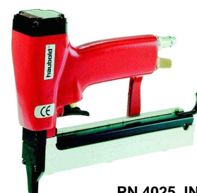
PN 4025 JN