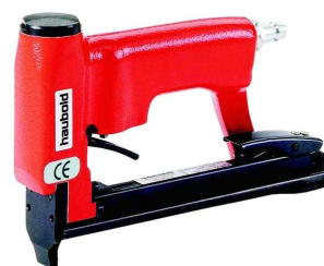
PN 1414 G