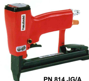
PN 814 JG/A